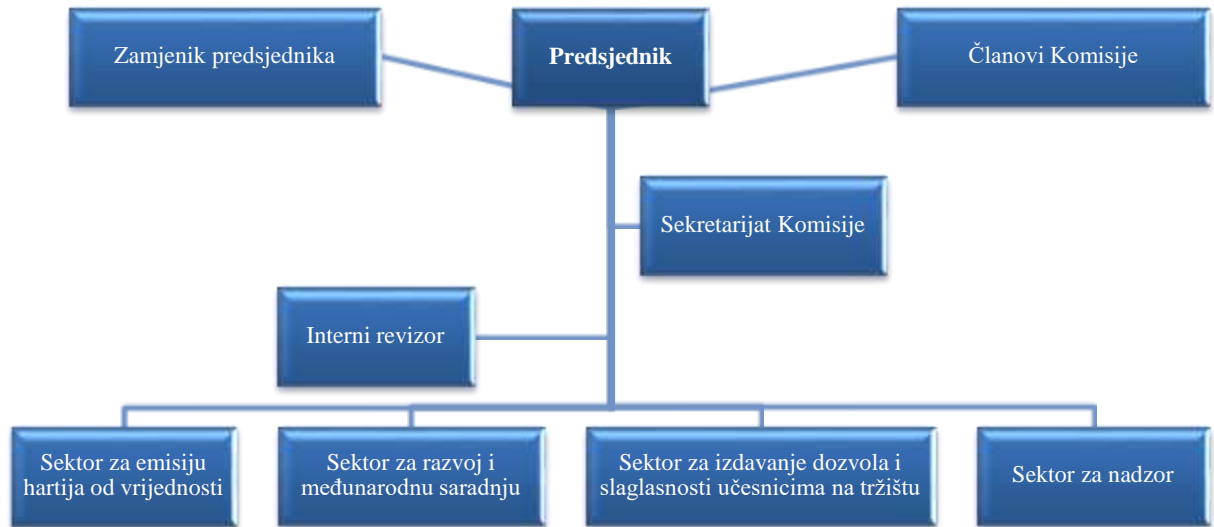
Slika 1. Organizaciona struktura Komisije

Sa stanovišta organizacione strukture, Komisiju čine četiri sektora i Sekretarijat.