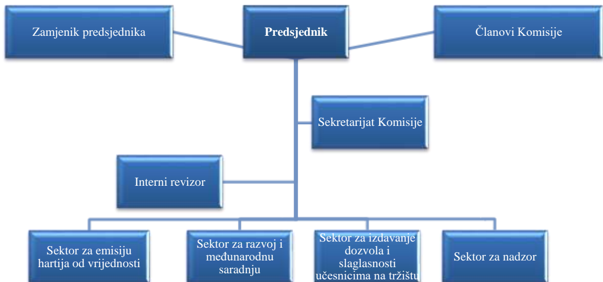
Slika 1. Organizaciona struktura Komisije

U okviru organizacionih cjelina Komisije, obavljaju se slijedeći poslovi: