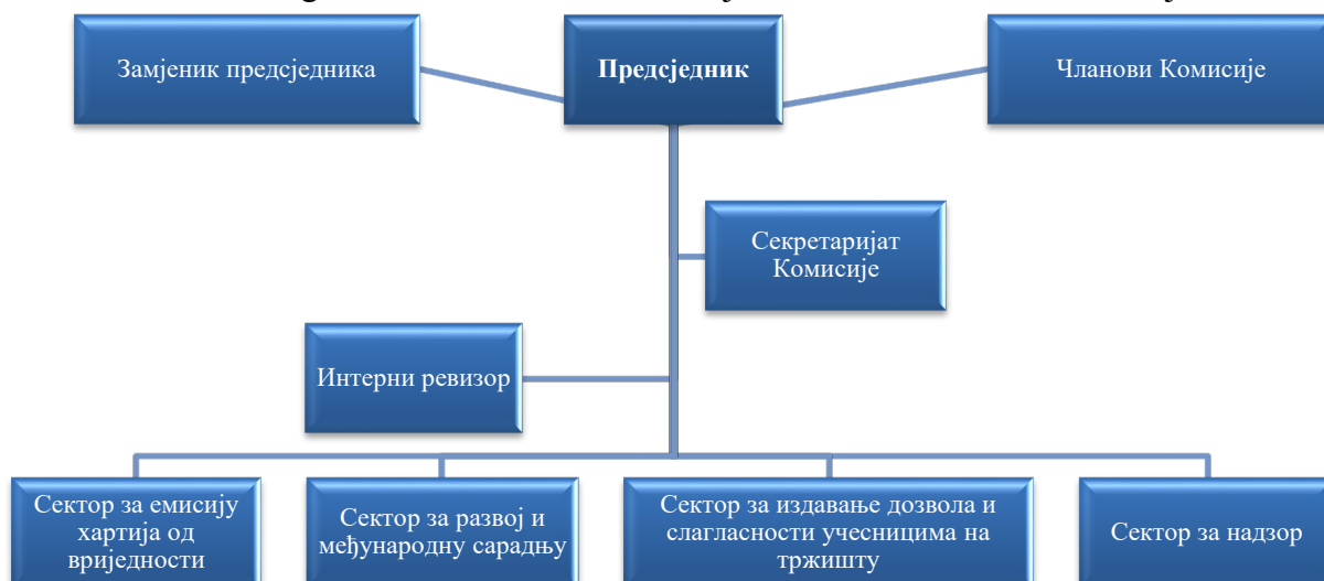
Slika 1. Organizaciona struktura Komisije

Sa stanovišta organizacione strukture, Komisiju čine četiri sektora i Sekretarijat.